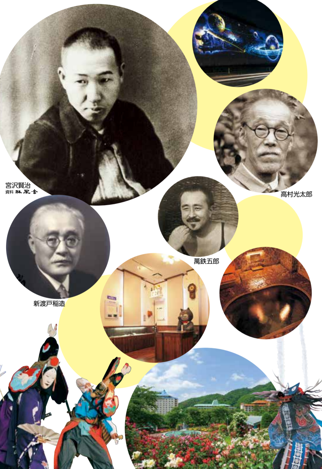
宮沢賢治 山本権吉 高村光太郎