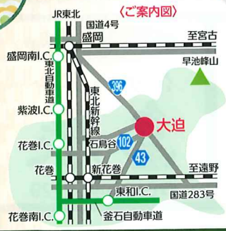
Photo: 古今雛(村田家所蔵) 《交通》 ■東北新幹線利用 ・新花巻駅下車タクシーで…25分 ・盛岡駅下車特急バスで…60分 ・北上駅下車JR東北本線乗り換え石鳥谷駅下車路線バスで…27分 ■飛行機利用 (札幌・名古屋・大阪・福岡より) ・花巻空港からタクシーで…25分 ■東北自動車道 ・東京方面から花巻ICより…20km ・青森方面から盛岡南ICより…30km ・釜石自動車道利用東和ICより…16km